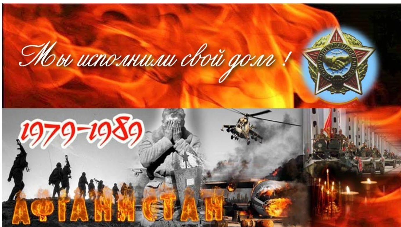
План мероприятий ко Дню вывода войск из Афганистана. В МБОУ «Бугленская СОШ имени Ш.И.Шихсаидова»