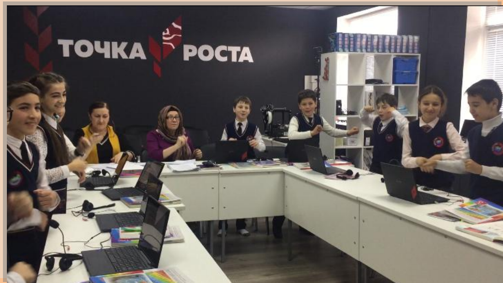
Момент релакса. Наблюдатели тоже не удержались...