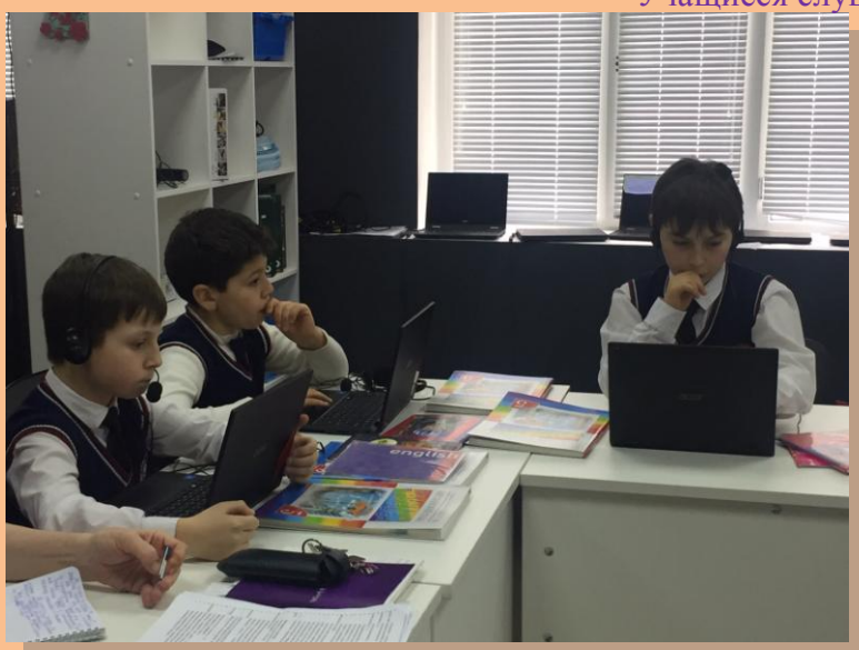
Фрагмент работы по аудированию