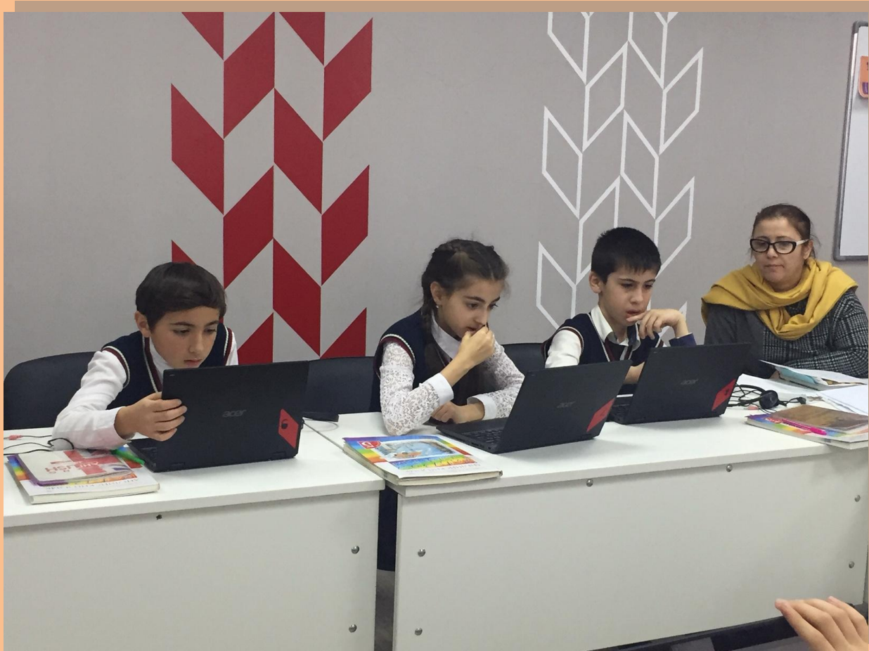
Задумались над заданием....