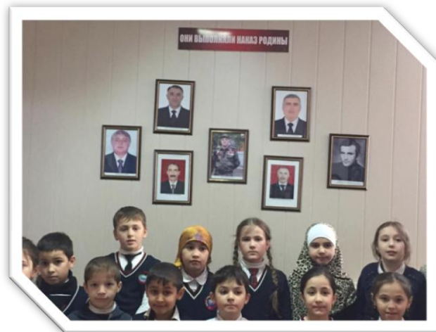
14.02.19.год МКОУ "Бугленская СОШ. имени Ш. И. Шихсаидова " ученики 3 "б" класса в сельском музее у стенда, посвященного бугленцам - воинам – интернационалистам.