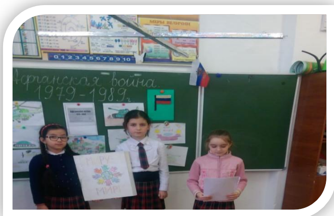
1.02.19.МКОУ "Бугленская СОШ. имени Ш. И. Шихсаидова" стенд «Афганистан боль моей души».