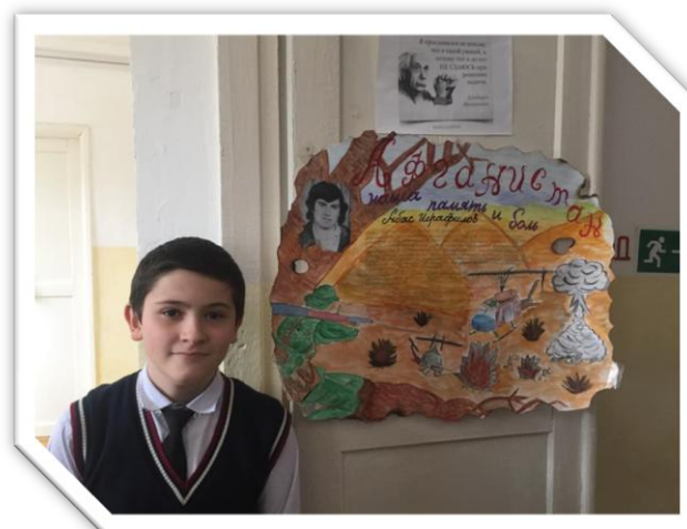
1-16.02.19.год стенды посвященные воинам-афганцам в МКОУ."Бугленская СОШ. имени Ш. И. Шихсаидова"